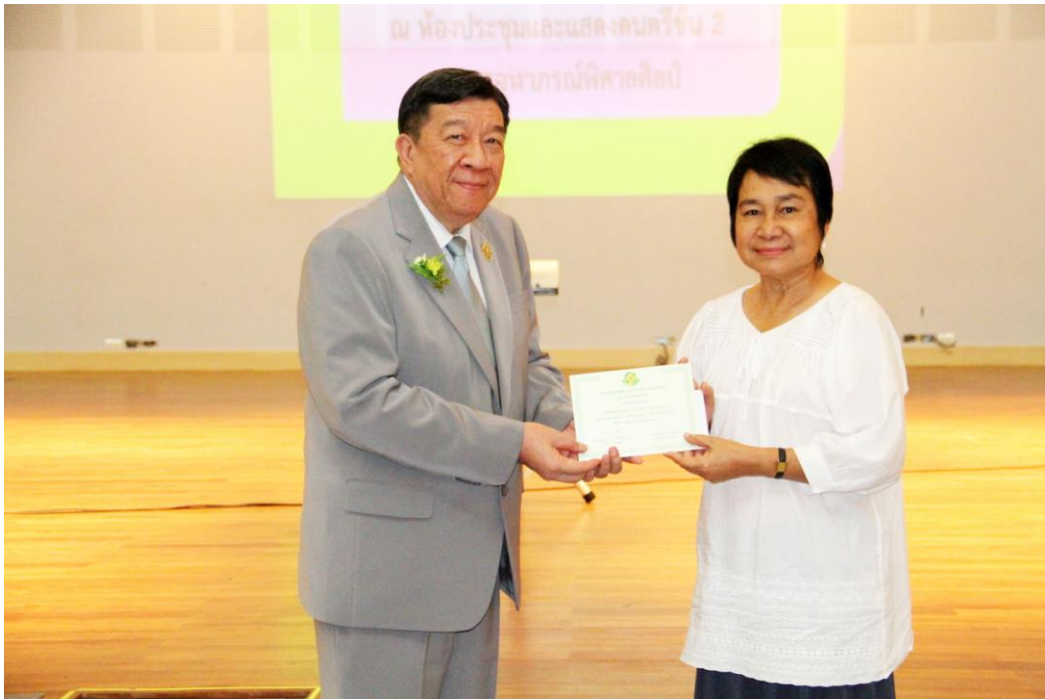
ภาควิชาวรรณคดีได้รับรางวัลเป็นหน่วยงานต้นแบบด้านการประกันคุณภาพ ประจำปี 2556 (รอบปีการศึกษา 2555 : 1 มิถุนายน 2555-31 พฤษภาคม 2556) และได้รับรางวัลพิเศษสำหรับหน่วยงานต้นแบบด้านการประกันคุณภาพต่อเนื่อง 4 ปีขึ้นไป (ประจำปี 2553-2556)