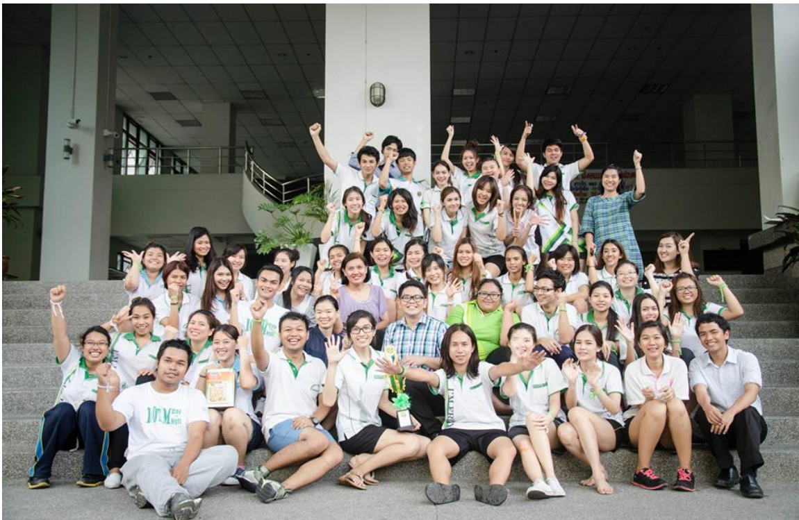
โครงการวรรณคดีกีฬาสัมพันธ์ สำนึกดี มุ่งมั่น สร้างสรรค์ สามัคคี ครั้งที่ 1 (กิจกรรม PDCA)