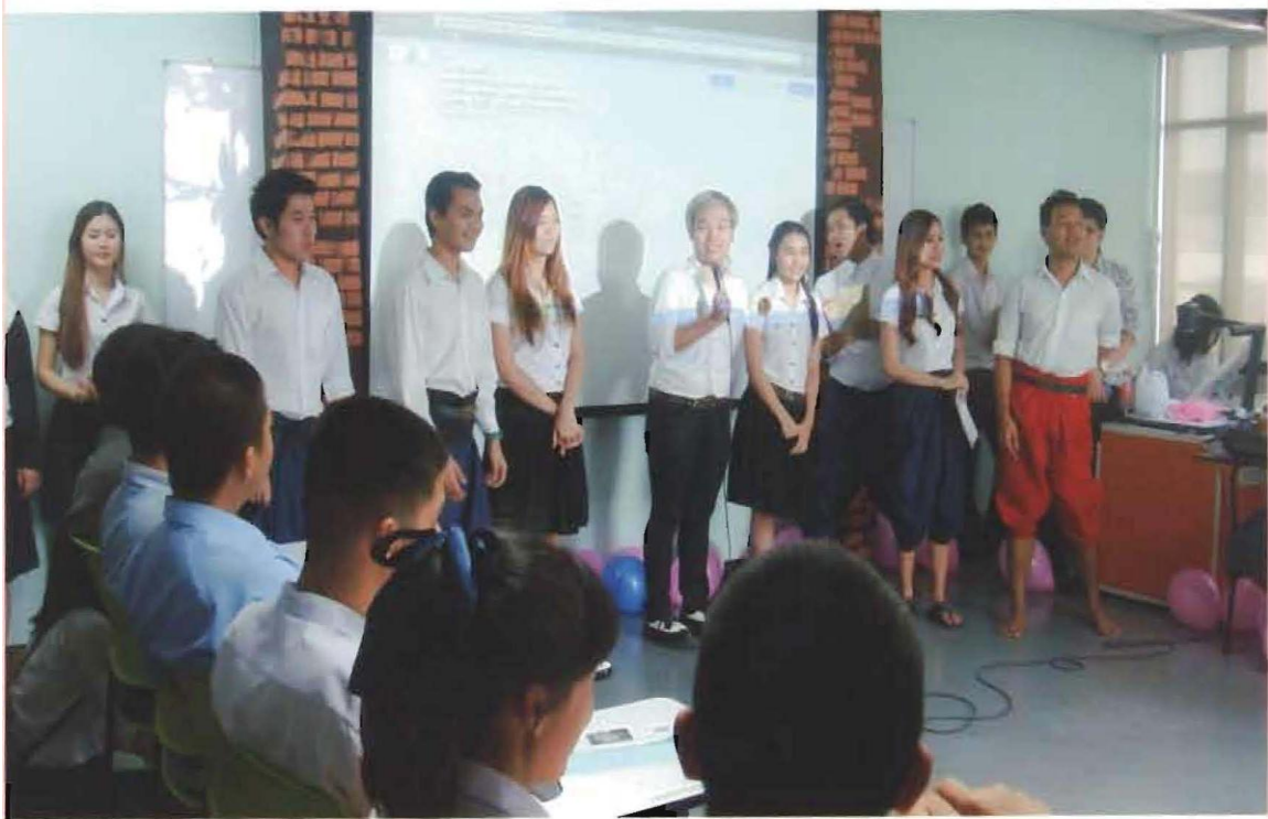
โครงการแผนพันธู์ทั่วรรณคดี (กิจกรรม PDCA)