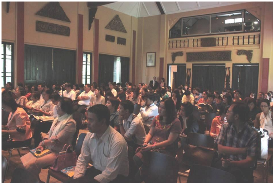
โครงการประชุมวิชาการระดับชาติ “พิพิธพรรณวรรณ : ความทรงจำและสยาม-ไทยศึกษาในบริบทสากล