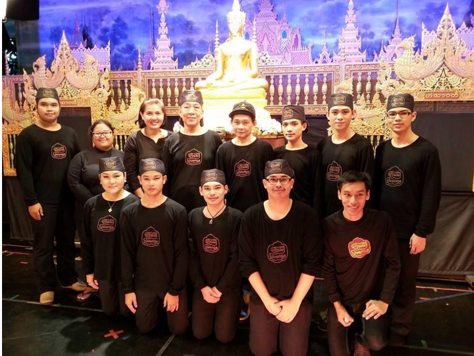
โครงการความร่วมมือกับมูลนิธิจักรพันธ์ุ โปะษยกฤต ในการทำนุบำรุงศิลปวัฒนธรรม