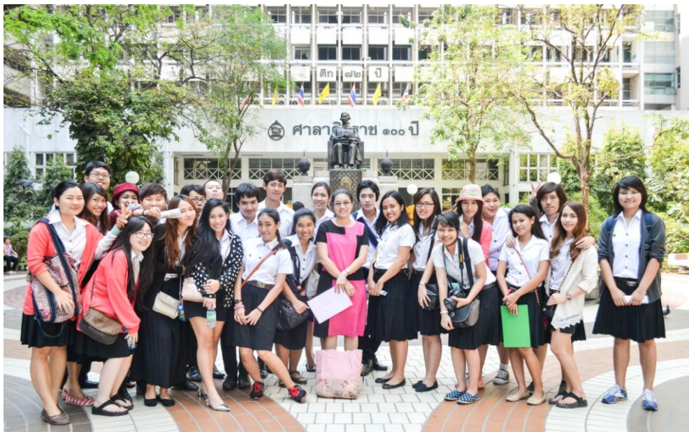
โครงการตามรอยวรรณคดีกับการท่องเที่ยวเชิงวัฒนธรรม (กิจกรรม PDCA)