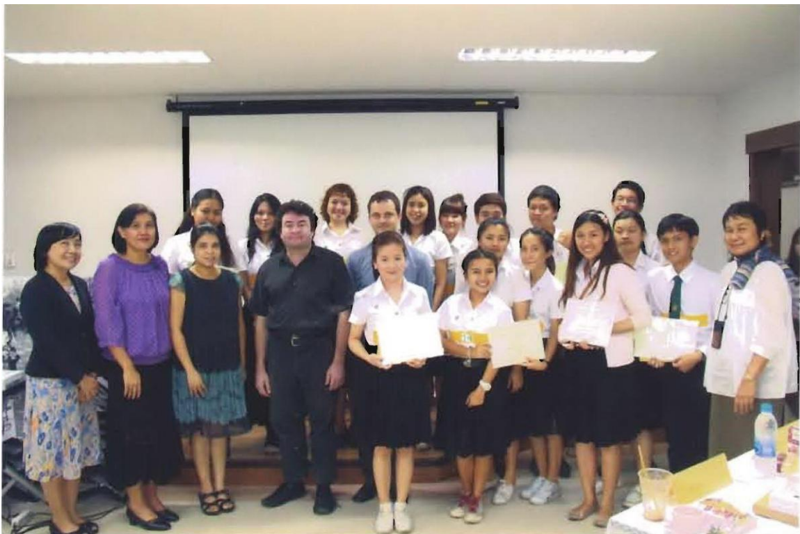
โครงการประกวดอ่านกวีนิพนธ์ภาษาอังกฤษ ครั้งที่ 11 (กิจกรรม PDCA)